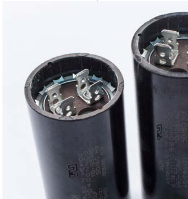
Capacitores de Arranque