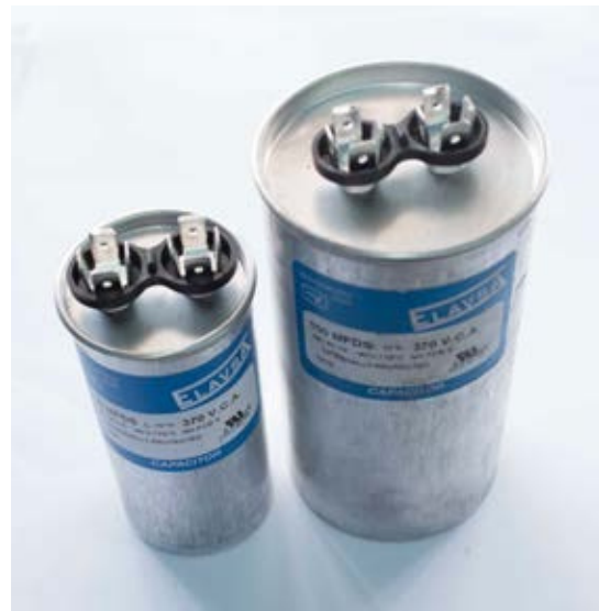
Capacitor de trabajo