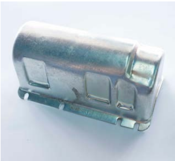
Tapa para Capacitor