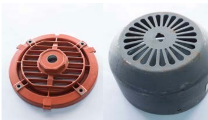
Tapa para Motor